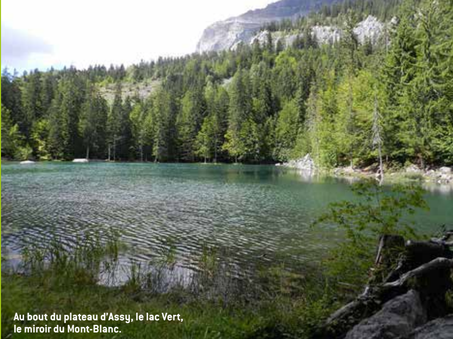
Au bout du plateau d'Assy, le lac Vert, le miroir du Mont-Blanc.