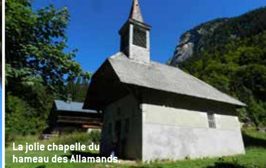
La jolie chapelle du hameau des Allamands