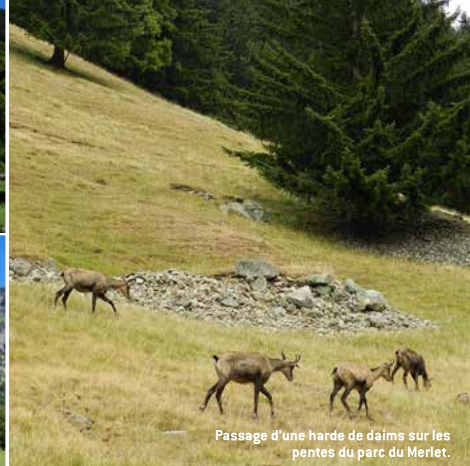
Passage d'une harde de daims sur les pentes du parc du Merlet.