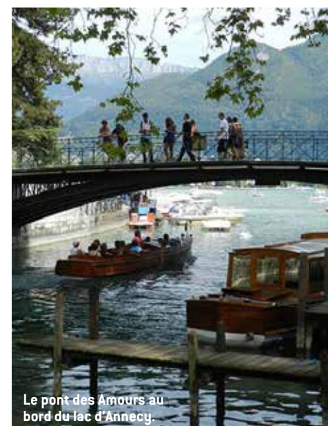
Le pont des Amours au bord du lac d'Annecy.