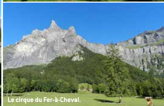
Le cirque du Fer-à-Cheval.