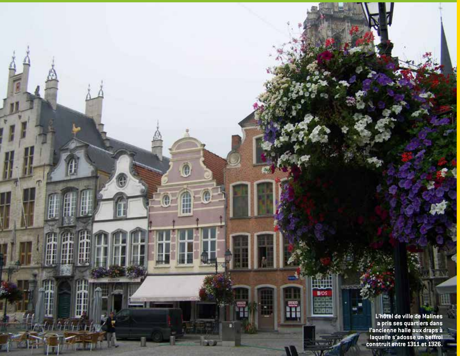
L'hôtel de ville de Malines a pris ses quartiers dans l'ancienne halle aux draps à laquelle s'adosse un beffroi construit entre 1311 et 1326.