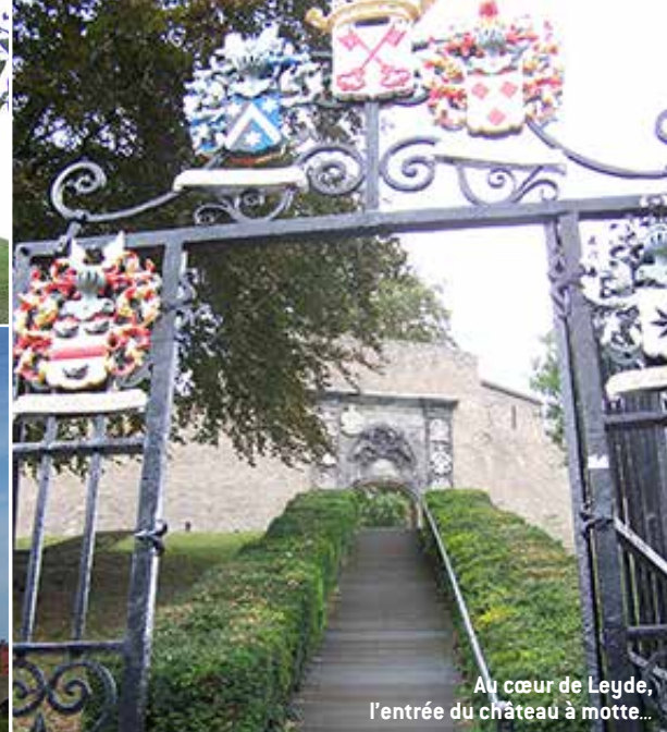
Au cœur de Leyde, l'entrée du château à motte...