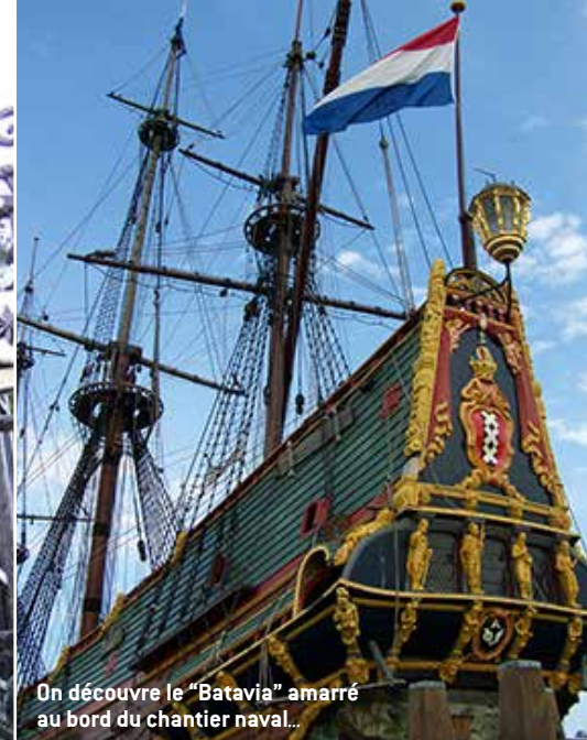
On découvre le "Batavia" amarré au bord du chantier naval...

du pays gagnées sur la mer, la fameuse province de Flevoland créée en 1986. Par les routes nationales on peut folâtrer à travers les campagnes, admirer les quartiers chics de Wassenaar où résident tant de diplomates à l'ombre des ailes de moulins et où les rues mènent à des plages sans fin. Toujours vers le nord, il ne faut pas manquer Leyde avec ses fossés d'eau dessinés "à la Vauban". Ville universitaire, ville natale de Rembrandt, ville aussi où furent apportées par les navigateurs les premiers bulbes de tulipes qui ont, depuis, essaimé à travers le monde !