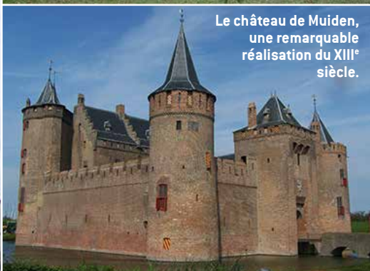
Le château de Muiden, une remarquable réalisation du XIII e siècle.