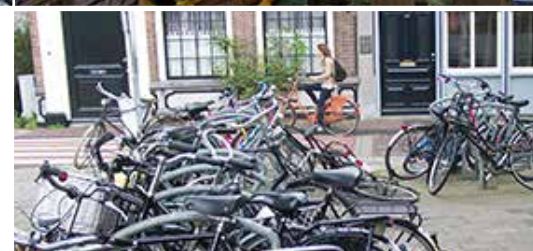
Aux Pays-Bas, le vélo est roi...

Mais nous sommes venus à Lelystad, non pas pour l'immense zone de magasins de marques, mais pour admirer un navire totalement reconstitué ; le "Batavia". Le navire avait été construit à Amsterdam en 1628 pour la Compagnie des Indes Occidentales. Il avait fière allure, portait 341 personnes, équipage et passagers confondus, était fortement armé de canons et cingla d'abord vers l'Indonésie. Puis le capitaine décida de gagner l'Australie, mais le bateau heurta, en vue des côtes, un récif et sombra. Une partie des occupants réussit à gagner la terre ferme, mais des querelles allaient opposer les survivants qui s'entre-tuèrent pour une obscure rivalité de chefs ! L'histoire de la première sortie du "Batavia" devint célèbre et quand, au XX e siècle, on retrouva l'épave, est né le projet de reconstruire le navire