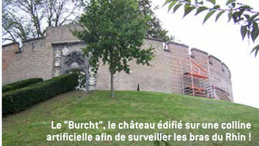
Le "Burcht", le château édifié sur une colline artificielle afin de surveiller les bras du Rhin !