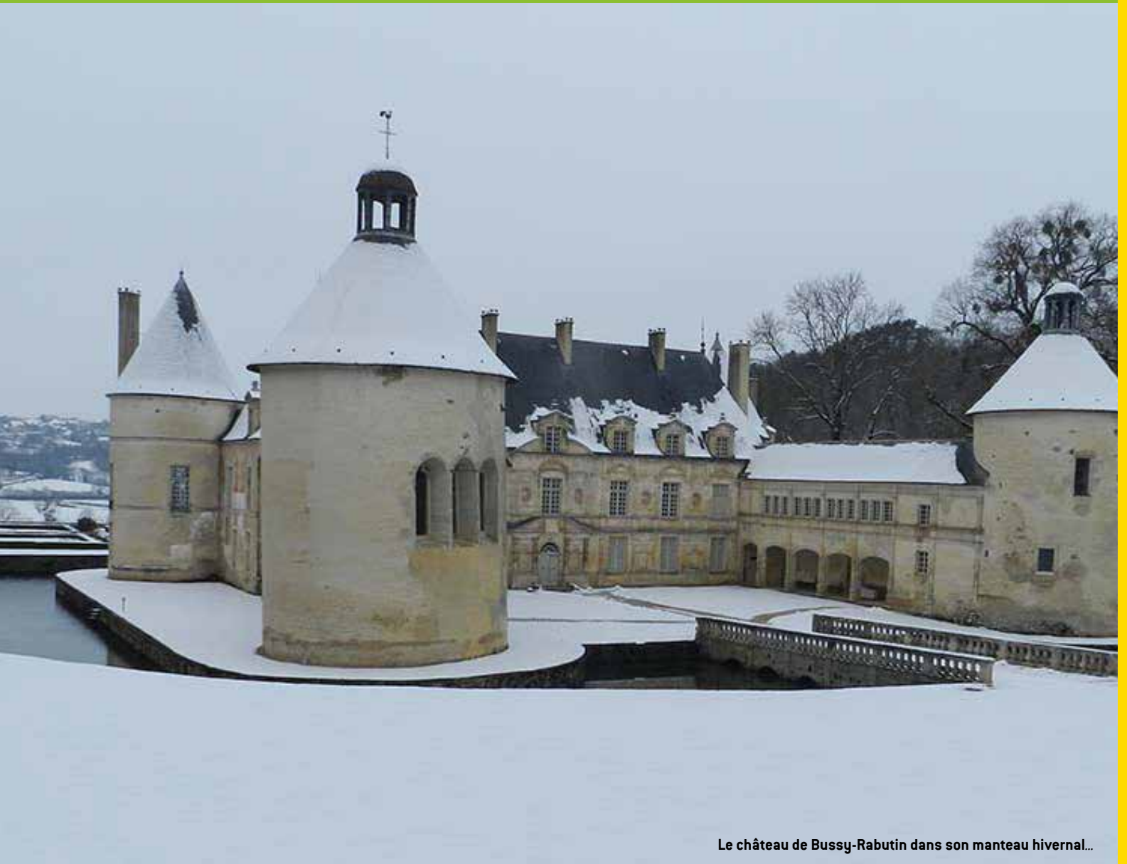
Le château de Bussy-Rabutin dans son manteau hivernal...