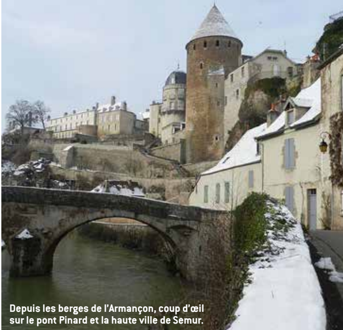
Depuis les berges de l'Armançon, coup d'œil sur le pont Pinard et la haute ville de Semur.