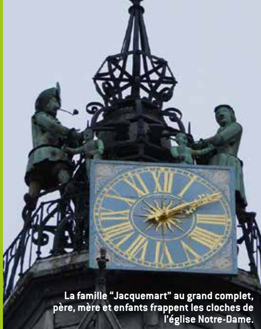
La famille "Jacquemart" au grand complet, père, mère et enfants frappent les cloches de l'église Notre-Dame.