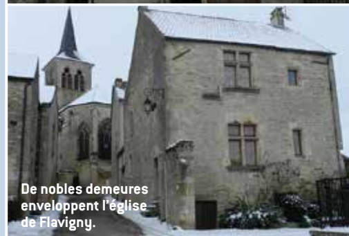
De nobles demeures enveloppent l'église de Flavigny.