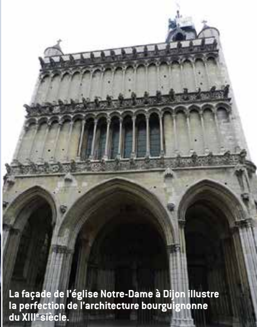
La façade de l'église Notre-Dame à Dijon illustre la perfection de l'architecture bourguignonne du XIII e siècle.