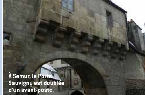
À Semur, la Porte Sauvigny est doublée d'un avant-poste.