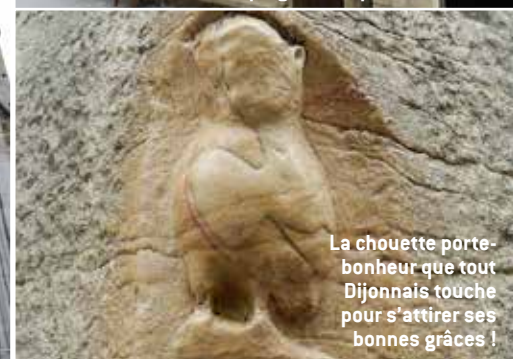
La chouette porte-bonheur que tout Dijonnais touche pour s'attirer ses bonnes grâces !

Dans l'église, les Dijonnais viennent déposer leurs soucis entre les mains d'une Vierge Noire... Puis, en contournant l'église par le flanc nord, par la rue de la Chouette, ne manquez pas de toucher la "chouette", petite sculpture polie par des milliers de mains qui se sont posées sur elle pour solliciter un "coup de chance".