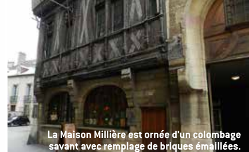
La Maison Millière est ornée d'un colombage savant avec remplage de briques émaillées.