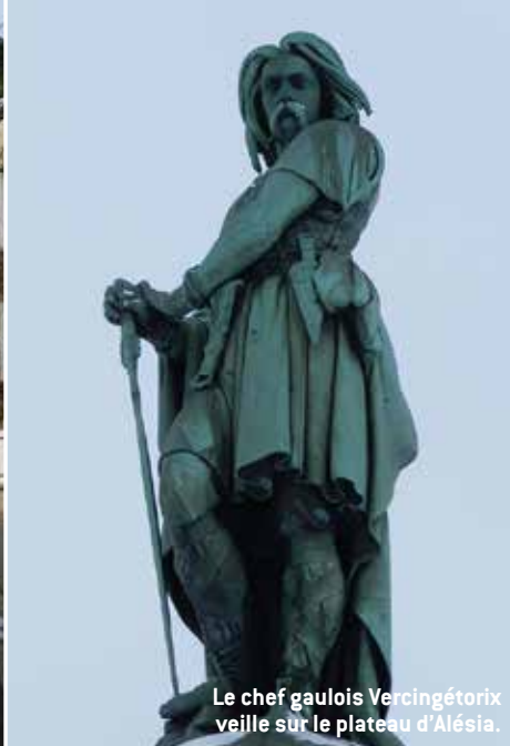
Le chef gaulois Vercingétorix veille sur le plateau d'Alésia.