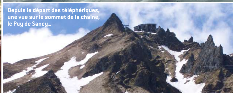
Depuis le départ des téléphériques, une vue sur le sommet de la chaîne, le Puy de Sancy...

Il faut se rappeler qu'à l'époque, l'électricité était encore rare et pour faire fonctionner l'installation il a fallu créer une retenue d'eau sur la Dordogne toute proche. Une usine hydroélectrique est alors née pour fournir l'énergie en courant continu de 3 400 volts ! À mi-pente, on croise la même voiture qui descend et fait contrepoids. Installé en 1898, ce fut le premier funiculaire de France. Il a connu, évidemment, quelques retouches sécuritaires et achemine sans peine ses quarante occupants à la station sommitale d'où des circuits pédestres permettent des promenades qui vous pousseront, peut-être, jusqu'au restaurant typique et, pour les plus courageux, jusqu'au sommet du Capucin à 1 485 m.