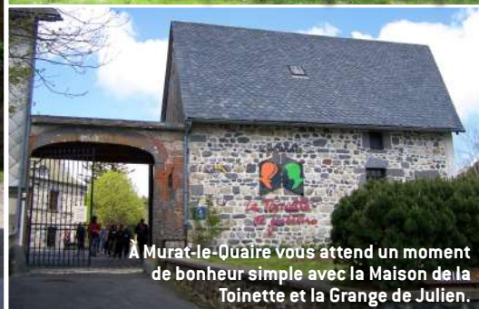
À Murat-le-Quaire vous attend un moment de bonheur simple avec la Maison de la Toinette et la Grange de Julien.