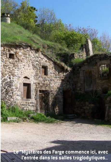
Le "Mystères des Farges" commence ici, avec l'entrée dans les salles troglodytiques...