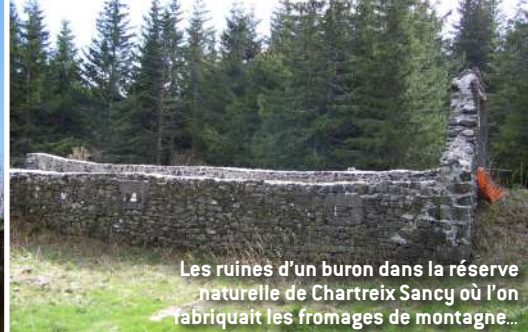
Les ruines d'un buron dans la réserve naturelle de Chartreix Sancy où l'on fabriquait les fromages de montagne...