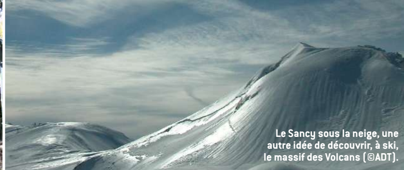
Le Sancy sous la neige, une autre idée de découvrir, à ski, le massif des Volcans.