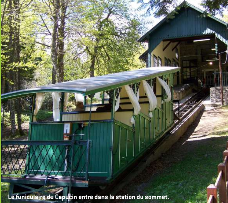
Le funiculaire du Capucin entre dans la station du sommet.